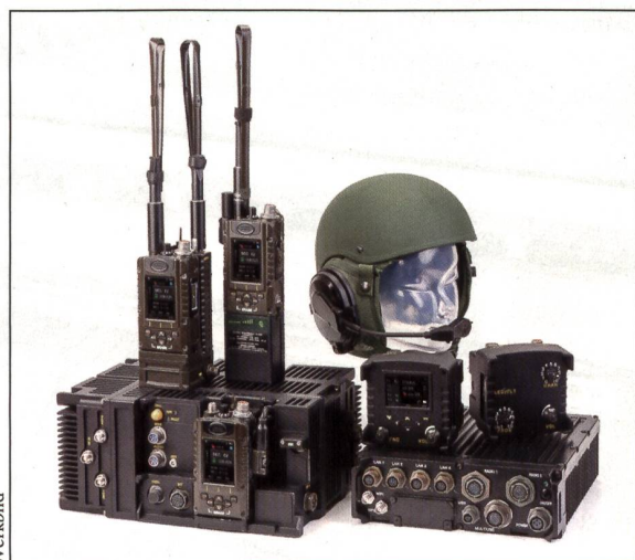
Das Elbit-System mit Boxen links und rechts. Sie sind fest im Fahrzeug eingebaut. Das linke Funkgerät mit Antennen dient dem Chef und das rechte trägt der Soldat. Die Geräte auf Box rechts dienen dem Fahrzeugführer und Beifahrer.