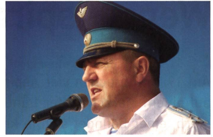
Generalmajor Andrej Naumets, der gefürchtete Kdt der 76. Luftsturmdivision.

neralstab mitteilte, landete das Bataillon tief hinter den feindlichen Linien im Hinterland des Gegners. Die Kämpfer unterbrachen wichtige Verbindungen und zerstörten Brücken, Strassen, Kraftwerke und Kommandoposten. Die Fallschirmjäger unterzogen die Fallschirme D-10, D-12 und Arbalet einem Härte-test. Sie gehören zum 104. Regiment der 76. Luftsturmdivision.