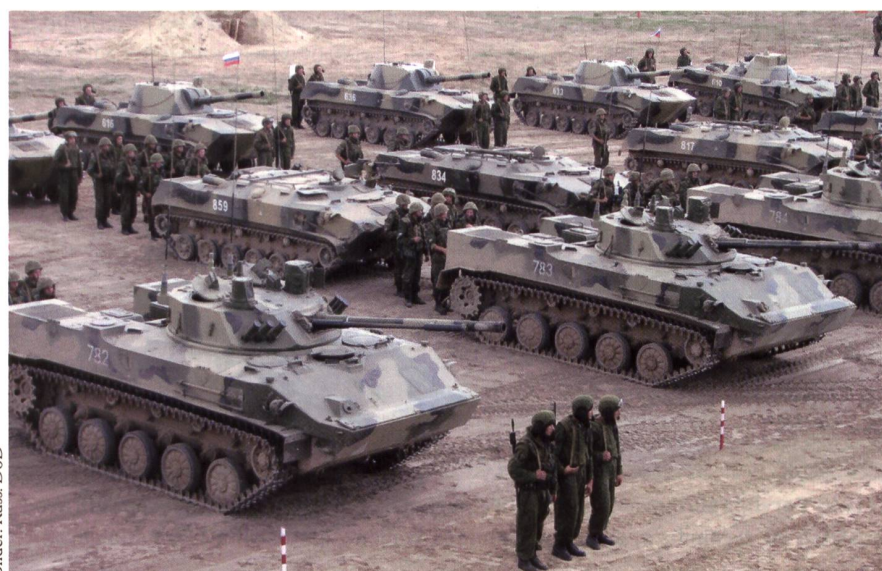
Teile einer russ. Luftlande-Kp. Von vorne: BMD-4-Spz; BTR-D; Mörser 2S9 NONA.