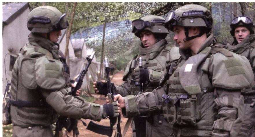
Fallschirmjäger in der neuen Kampfausrüstung der russischen Streitkräfte.

ab. Das Bataillon führte neue Kampfmaschinen mit, die an der linken und der rechten Flanke den Übergang unserer Truppen zum Gegenangriff deckten». Wie der Ge-