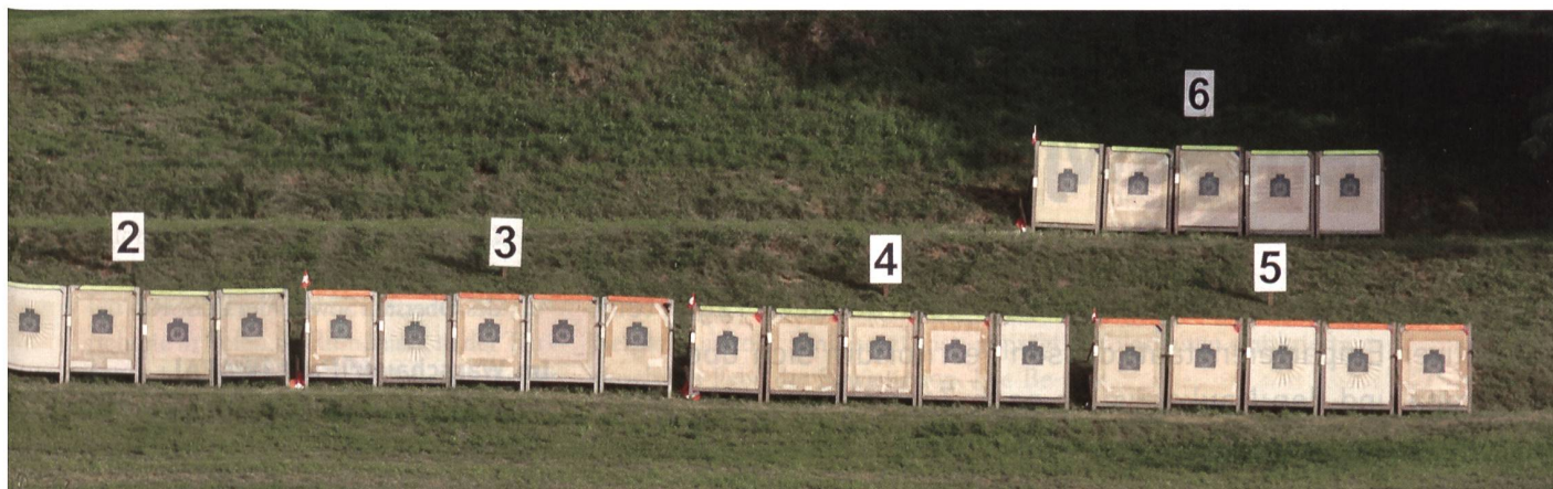
Blöcke zu fünf Scheiben; Distanz 240 Meter