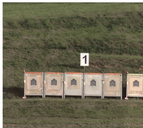
Ein Gewehr-Scheibenwald B5 am Stoss, sechs