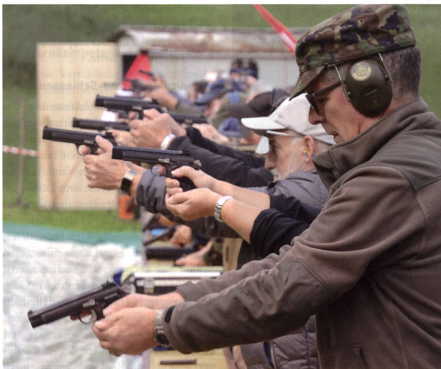
Treffsicher mit der Pistole.

glied Überfallschützenverbandes, der hier regelmässig 30 Punkte und 9 oder gar 10 Mouchen bucht – wir ziehen den Hut.