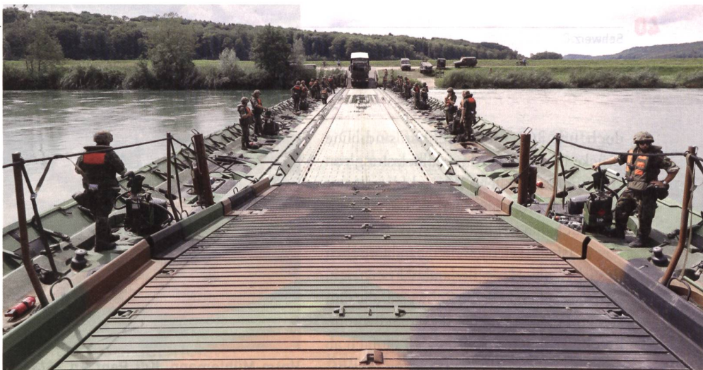
Nach erstaunlich kurzer Zeit steht die Brücke – heisst es: «PASSAGGIO».

Die einzelnen Brückenmodule, welche ab riesigen Sattelschlepper-Lastwagen nach und nach in den Hagneckkanal gleiten und in gezielten Manövern zur Brücke zusammengekoppelt werden, sind mit zwei 90 PS Aussenbordmotoren ausgerüstet, welche keinen Rückwärtsgang haben, je-