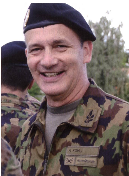
Br Kohli, Kdt Inf Br 5, bald Mech Br 4.