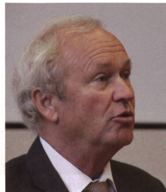
Regierungsrat Winiker, Luzern.