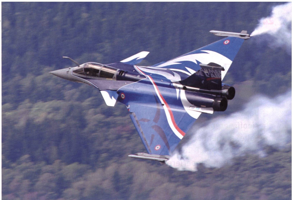
Noch einmal Nationalfarben: Der französische Rafale von Dassault. Ein Spitzenjet.

Die weltberühmten Frecche Tricolori der italienischen Luftwaffe malen ihre drei Nationalfarben in den Himmel über Sion.