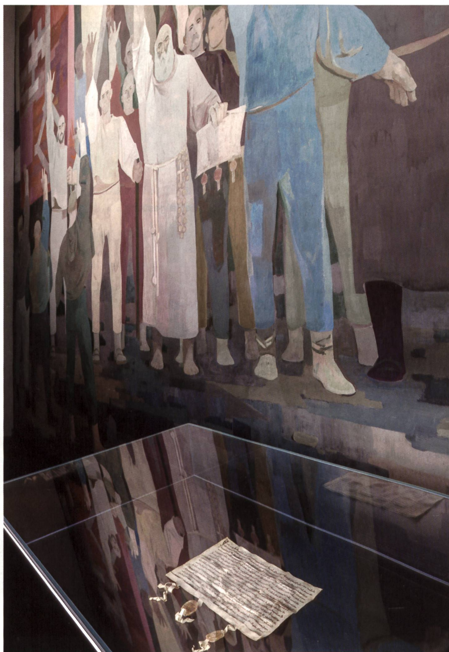
Der Bundesbrief von 1291 in Schwyz. Bis heute sind die letzten Rätsel rund um dieses aussergewöhnliche Dokument nicht ganz geklärt.