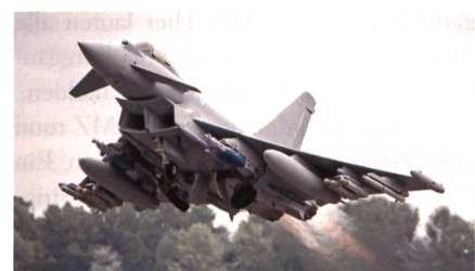
Verbesserung im Luft-Boden-Bereich.

Die aktuelle Brimstone Variante kann mit verschiedenen Such- und Gefechtsköpfen ausgerüstet werden und hochpräzise gegen gepanzerte Fahrzeuge eingesetzt werden. Die Brimstone Tests erfolgen im Rahmen des