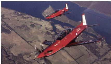
PC-21 Trainingsflugzeuge für Australien.

Die PC-21 Turboprop Trainingsflugzeuge sollen in Australien sowohl für das Basic Training als auch für das Training fortgeschrittener Piloten eingesetzt werden. Nach der Schulung auf der PC-21 sind die Piloten in der Lage auf die F/A-18