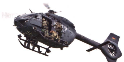
Ausgeliefert an die Spezialkräfte.

Die Bundeswehr hat die letzte H145M LUH SOF übernommen, welche bei den Spezialkräften der Bundeswehr eingesetzt wird. Die Bundeswehr hatte im Jahr 2013 als Erstkunde insgesamt 15 Maschinen bestellt und Ende 2015 die ersten Helikopter in Empfang genommen. Mit der letzten Auslieferung der 26+15 hat Airbus Helicopters nach eigener Aussage das gesamte Programm im vorgegebenen Zeit- und Kostenrahmen umgesetzt. LUH SOF steht für «Light Utility Helicopter (LUH) Special Operations Forces (SOF)», also «Leichter Unterstützungshelikopter für Spezial-