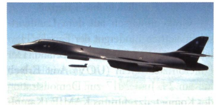
Erfolgreicher Abschuss eines LRASM Langstrecken-Seezielflugkörpers.

Die Long Range Anti-Ship Missile von Lockheed Martin hat ihren ersten kompletten Testflug bis zum Einschlag im Ziel absolviert. Startplattform war eine B-1B Lancer. Nach dem Abwurf vom B-1B-Bomber, folgte die dem Serienstandard entspre-