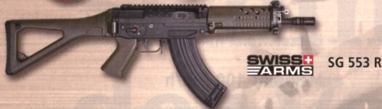
SWISS ARMS SG 553 R