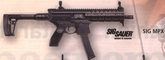
SIG SAUER SIG MPX