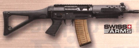
SWISS ARMS SG 553