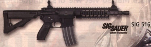
SIG SAUER SIG 516