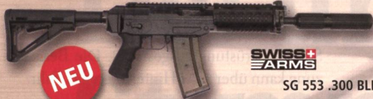
SWISS ARMS SG 553 .300 BLK