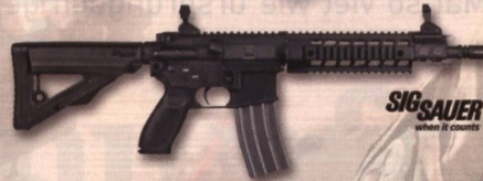
SIG SAUER SIG 516