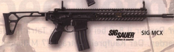
SIG SAUER SIG MCX