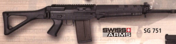
SWISS ARMS SG 751