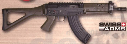
SWISS ARMS SG 553 R