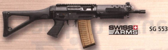
SWISS ARMS SG 553