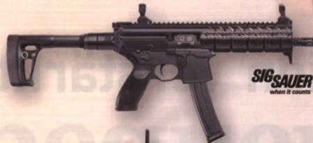
SIG SAUER SIG MPX