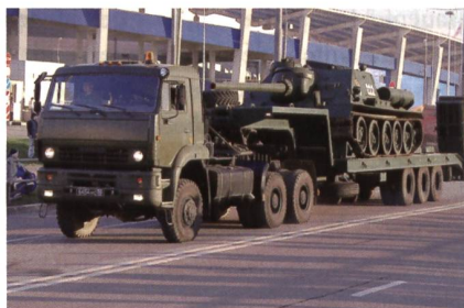
Der Tieflader Kamaz-65225 bildet das Rückgrat der neuen Putin-Regimenter.