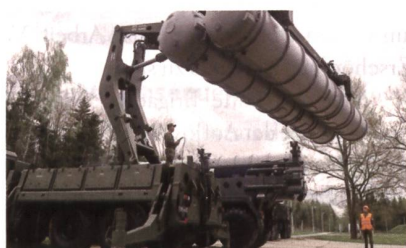
Das moderne S-400-Flabsystem.

Zwischen Russland und der Türkei bahnt sich eine politische Sensation an: Wie Präsident Erdogan am 25. Juli 2017 angekündigt, steht Ankara vor dem Kauf des russischen Flab-Systems S-400.