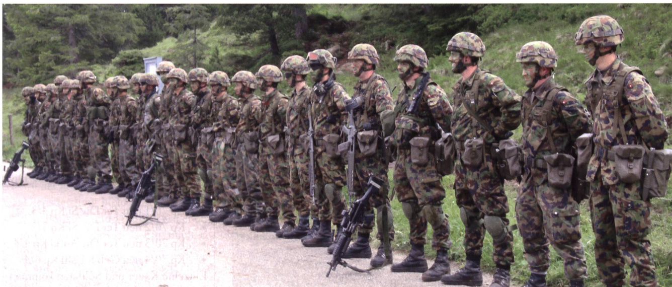
Der Zug BIVIO der Inf Kp 70/1.