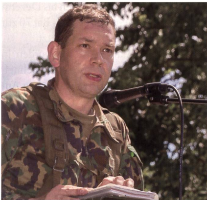
Dank von Bat Kdt Rengel an seine Kader und Soldaten.

Im Verlauf des 3. Quartal 2017 soll jeder AdA vom FST A, Pers (J1) einen Brief mit seiner neuen Einteilung ab 1.1.2018 erhalten.