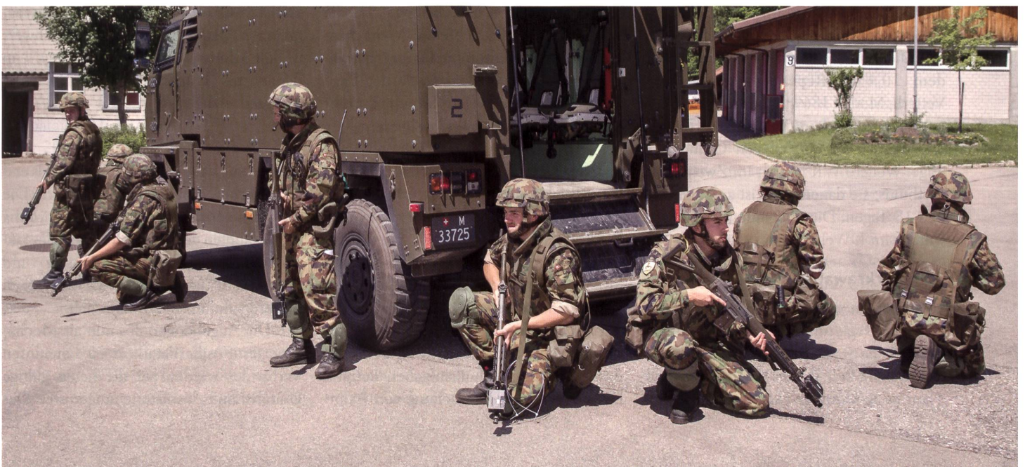
Inf Kp 16/3 durchsucht die Aussenstelle Blankenburg des Armeelogistik Center Thun nach hybridem Gegner.