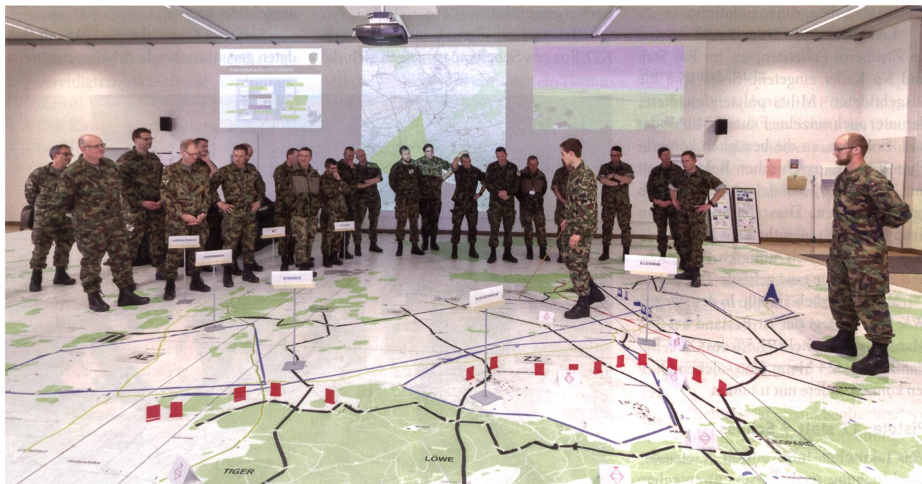
Bewährung im Taktischen Dialog am professionell und übersichtlich gestalteten Geländemodell.