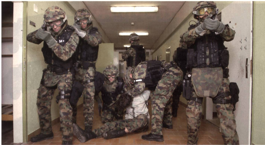
Kameradenhilfe im Militärpolizeibataillon 1. Lesen Sie die Seiten 18–21.