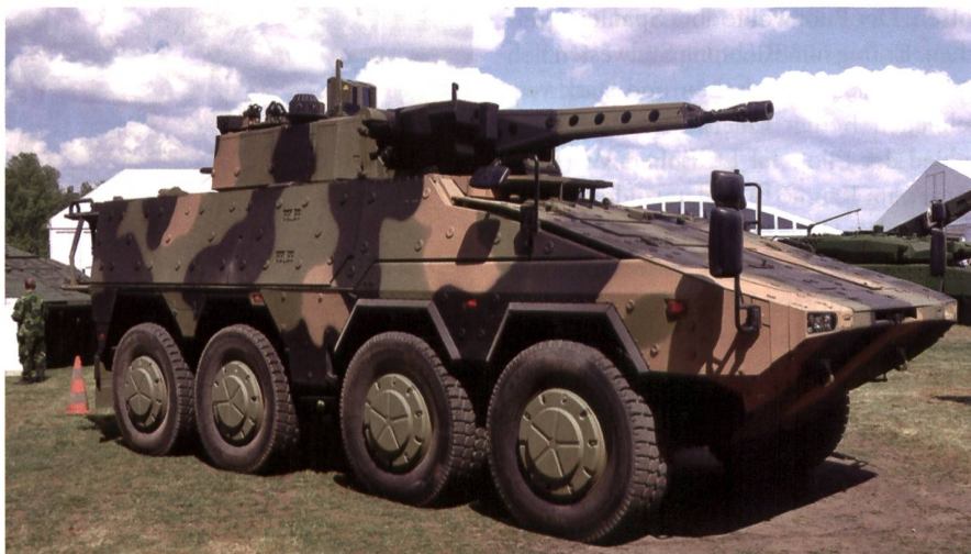
Schützenpanzer Boxer von ARTEC (64% Rheinmetall, 36% KMW).