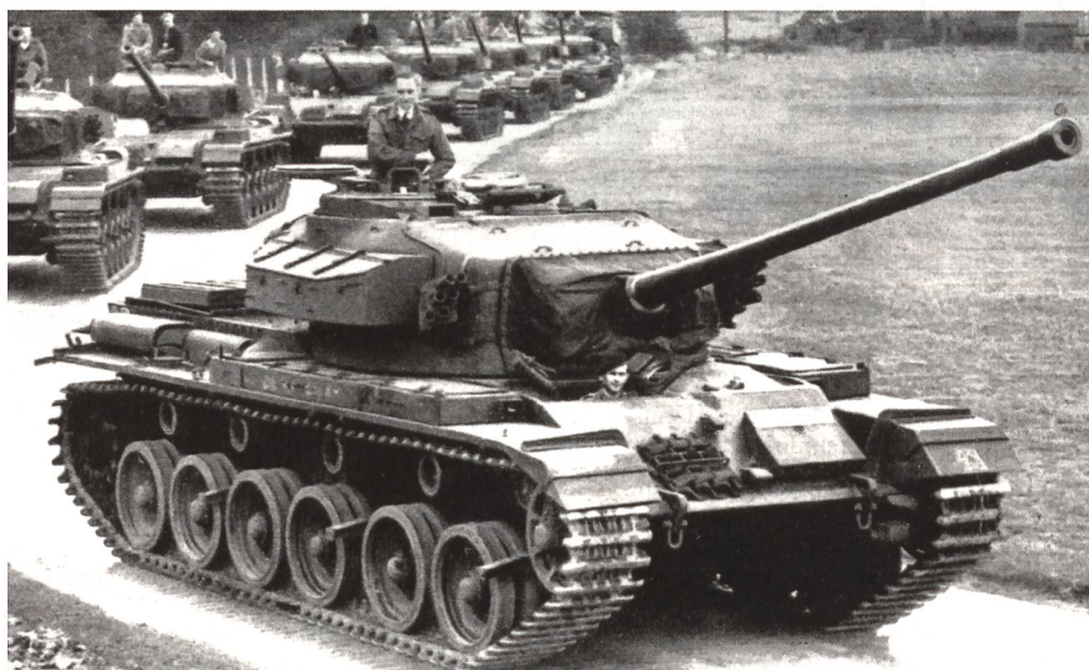
Der Panzerkampfwagen Centurion III-VII mit 8,34-cm-Kwk (Schwedens Strv-81).