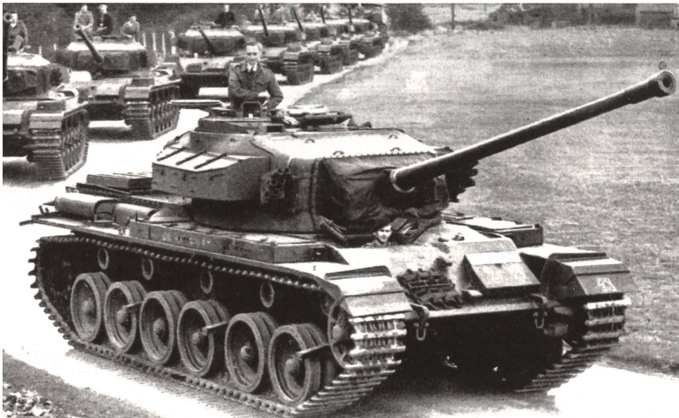
Der Panzerkampfwagen Centurion III-VII mit 8,34-cm-Kwk (Schwedens Strv-81).