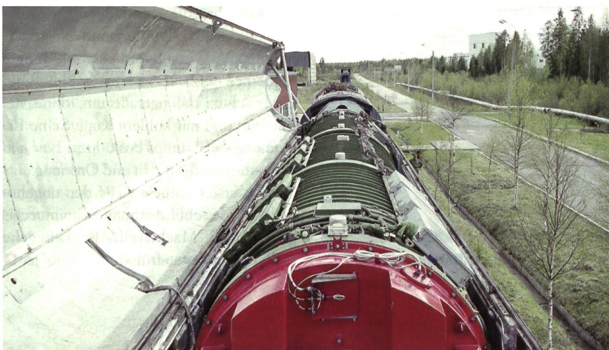
Der russische Geisterzug Bargusin bringt Interkontinentalraketen in Stellung.