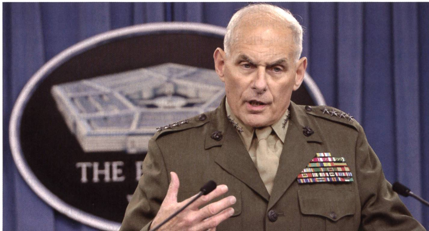
General John Kelly 2014 als Kommandant des Südkommandos der Streitkräfte.