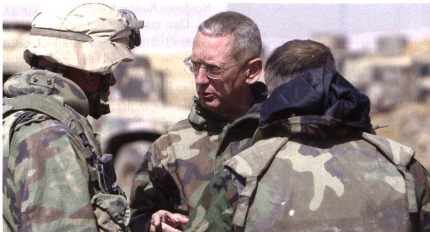
General Mattis (mit Brille), heute Verteidigungsminister, erteilt Befehle im Irak.