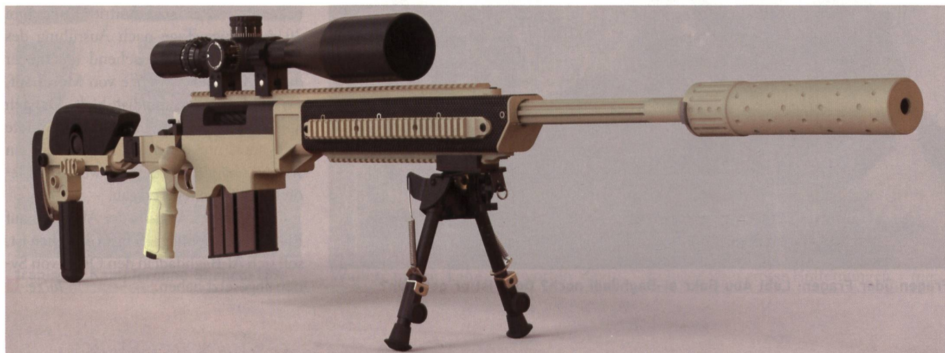
Der Rekord wurde mit einem McMillan TAC-50 erzielt.

Bis 2 km ist es mit dem richtigen Paket möglich, danach ist es Glück. nyf.