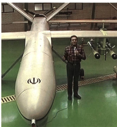
Iranische Kampfdrohne Shahed-129.

Die Drohne Shahed-129 fliegt 2000 km weit und führt auch ausserhalb der iranischen Grenzen Kampfeinsätze durch.