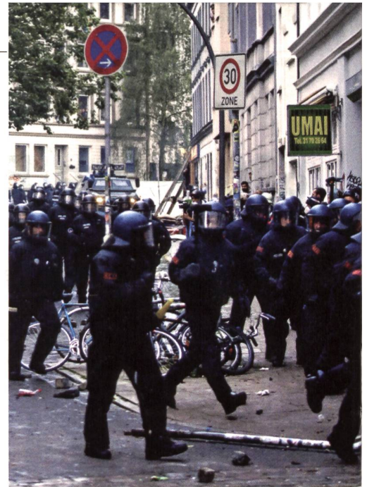
Bereitschaftspolizei im Ammarsch.

Um 8.12 Uhr erlässt die Einsatzzentrale landesweit einen dramatischen Appell. Sie sendet ein Fernschreiben an den Bund und an alle Bundesländer: «Bitte schickt alles, was Ihr habt».