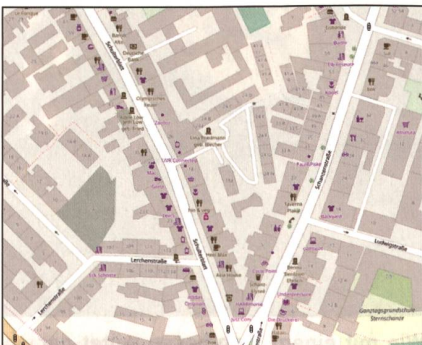
Das Schulterblatt, die wichtigste Strasse, verläuft nach links oben.