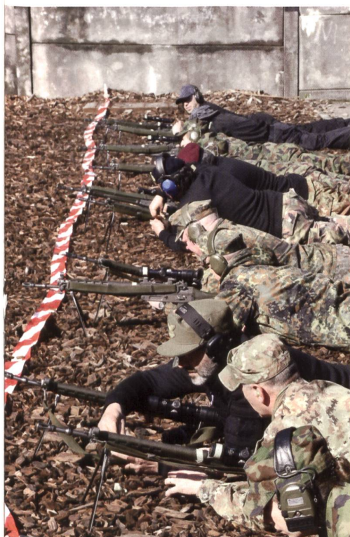
Das internationale Schiessen fand auf hohem Niveau statt.