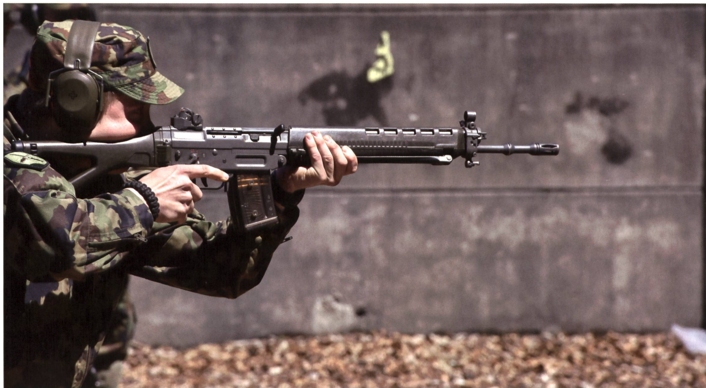
Der Posten Basic Rifle, hier war gute Einzelarbeit das A und O.

Von den Teilnehmern gab es viel positives Echo für die fünfte Auflage des militäri-