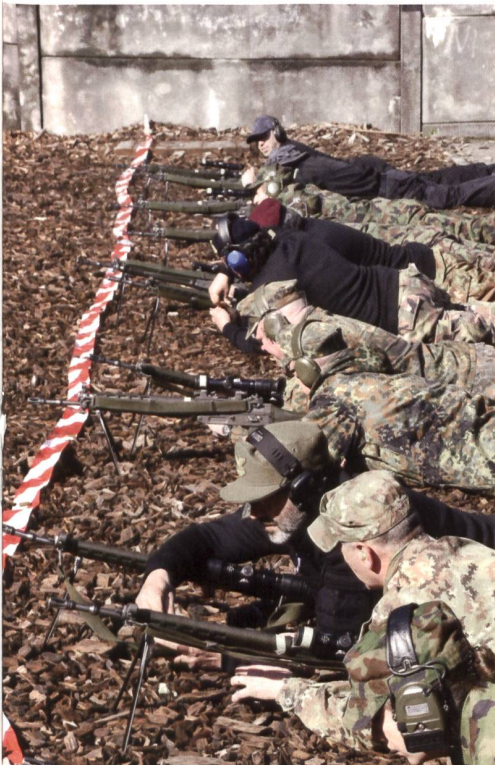
Das internationale Schiessen fand auf hohem Niveau statt.