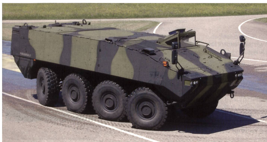
Der Piranha-5 ist bereit.

Vom Mowag-Testgelände bei Bürglen TG berichtet unser Korrespondent Wm Peter Gunz