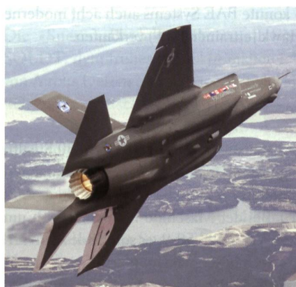
Rheinmetall: Munition für den F-35.

Ausserdem komplettiert Rheinmetall mit der ausgewählten neuen Munitionssorte 25mm x 137 Frangible Armour Piercing (FAP) seine Flugzeugmunitionspalette um eine leistungsfähige Komponente und kann seine hohe Kompetenz im Bereich der Flugzeugbewaffnung voll einbringen.