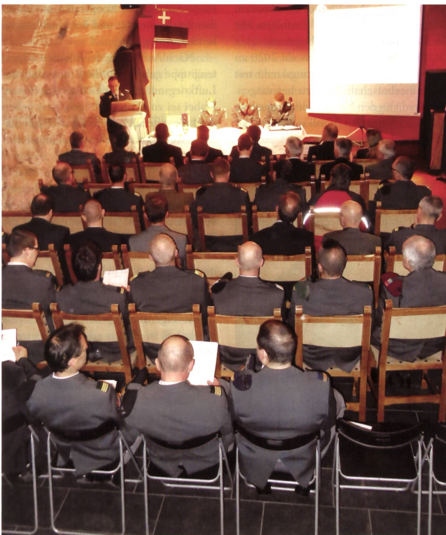
Im stimmungsvollen Rathauskeller von Burgdorf tagt die KOG Bern.