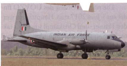
Transportflugzeug AVRO HS-748.

Laut dem Luftwaffenchef Birender Singh Dhanoa will Indien erneut einen Anlauf starten, um 56 mittelschwere Militärtransporter zu beschaffen. Dabei stehen die Karten für den C-295 gut. Die ersten 16 Maschinen könnten direkt ab dem Airbus Werk in Spanien geliefert werden, während die übrigen Maschinen dann in Indien