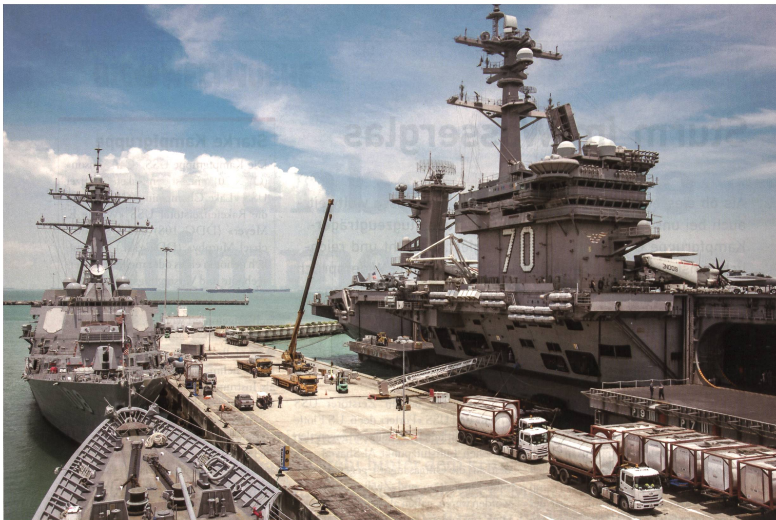
Die USS «Carl Vinson» (rechts), der Kreuzer USS «Lake Champlain» (vorne) und der Raketenzerstörer USS «Wayne E. Meyer» (hinten) hielten sich vom 4.–8. April 2017 zu einem Besuch in der Changi Naval Base von Singapur auf.

hatte dabei nie gesagt, wann dieser Verband dort sein würde oder wann er effektiv Kurs dorthin nehmen würde. Eine Woche vorher hatten die USS «Carl Vinson» und ihre Begleitschiffe eben einen Hafenbesuch in Singapur (4.–8. April 2017) und in Malaysia beendet. Der danach geplante Besuch von Fremantle in Westaustralien wurde annulliert, einige kurze Übungen mit der australischen Marine im Nordwesten Australiens (Indischer Ozean) wurden jedoch noch absolviert.