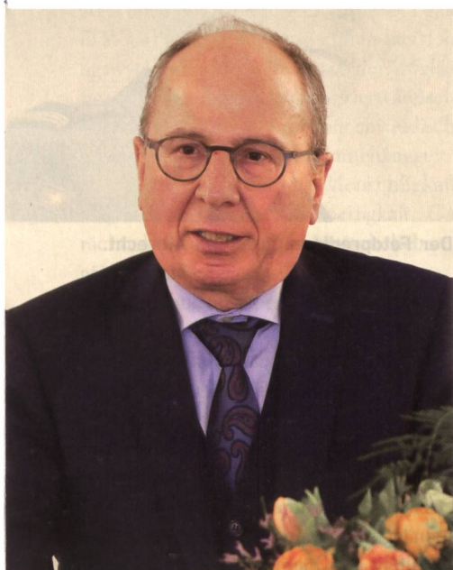
Regierungsrat Fredy Fässler, St. Gallen.