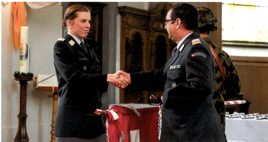
Uem/FU Schulen 61: Brevetierung in der katholischen Kirche Weinfelden – Seite 22.