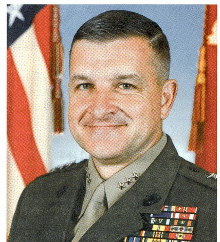
Anthony Charles Zinni, geboren 1943.

Das Central Command befehligte Zinni von 1997 bis 2000. Heute doziert er am College of William and Mary . Wenn er seine Stimme erhebt, dann horchen die Vereinigten Staaten auf.