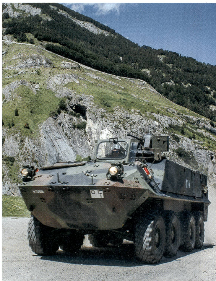
Unverzichtbar auch im Geb Inf Bat 77: Der Piranha 2.