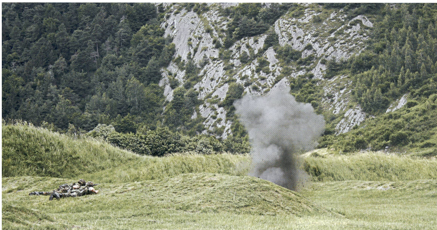
«Achtung – eine HG!».