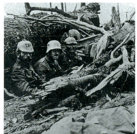
Vor 100 Jahren: Die Schlacht von Verdun