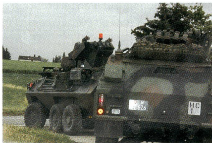
Aufklärer am Werk.

Die Aufklärungsbataillone der beiden Panzerbrigaden 1 und 11 sind in ihrer Be-