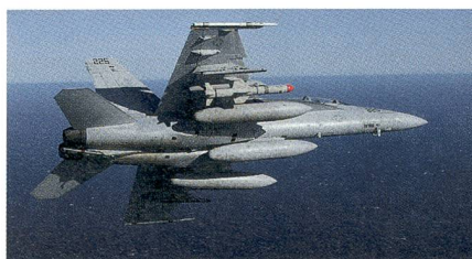
Super Hornet mit dem neuen Seezielflugkörper AGM-84N Harpoon Block II+.

Eine Super Hornet der US Navy hat einen modifizierten Seezielflugkörper AGM-84N Harpoon aus dem Block II+ erfolgreich abgefeuert. Der modernste Harpoon Seezielflugkörper wurde zuerst halbaktiv über den