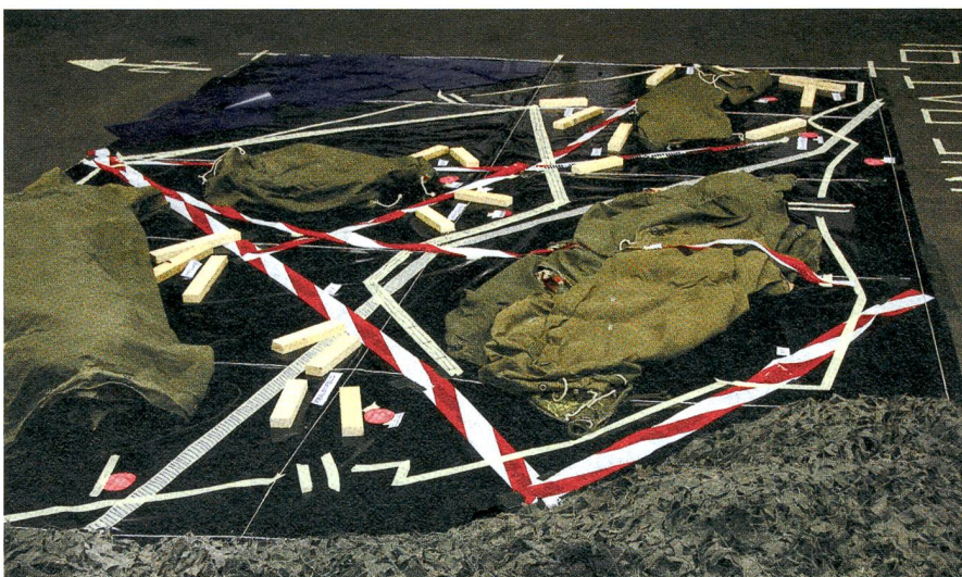
Geländemodell des Geb Inf Bat 91: Der Thurgauer Seerrücken.

her. Der Schaffhauser Staatsarchivar Roland E. Hofer referierte in der wunderbar getätigten Rathauslaube zur sicherheitspolitischen Lage des Grenzkantons im gegenwärtigen und historischen Kontext.