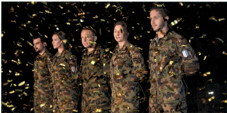
Goldregen in Stans: SWISSINT stellte schon 10 000 Peace Supporter – Seiten 14/15.