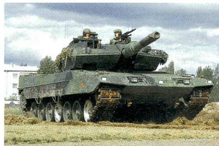
Neue Elektronik für den Stridsvagn 122.

Saab wurde von Krauss-Maffei Wegmann beauftragt, für die schwedischen Kampfpanzer Leopard 2 mit der Bezeichnung Stridsvagn 122 eine neue Fahrzeugelektronik mit Geräten und Verkabelung zu entwickeln und zu liefern. Mit dem Auftrag