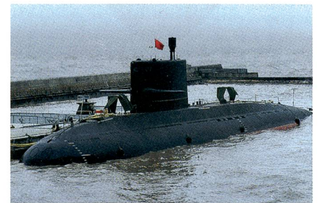
Chinesische U-Boote der YUAN-Klasse.

Nun wurde entschieden, drei U-Boote der YUAN-Klasse für ca. 1,3 Milliarden