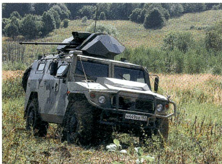
Test des GAZ Tigr mit 30-mm-Kanone.

Das ferngesteuerte Fahrzeug konnte in ersten Fahr- und Schiesstests überzeugende Ergebnisse erzielen. Der Tigr wird seit 2004 produziert und wird neben der russischen Marineinfanterie und dem russischen Heer