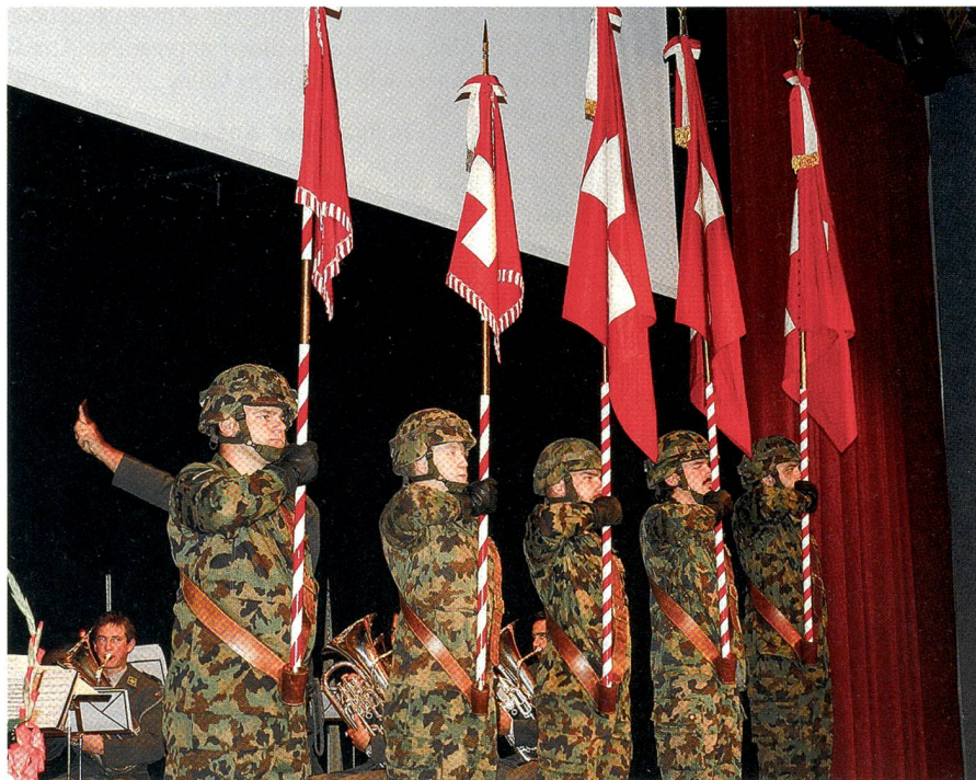
Die Suisse romande hat Sinn für Repräsentation: Die Feldzeichen der Ter Reg 1.

Luxemburg, erklärte die Sicherheitslage in und an den Grenzen von Europa.