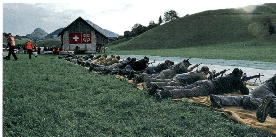
Wenige Meter neben der Hauptstrasse: die Gewehrscützenlinie.