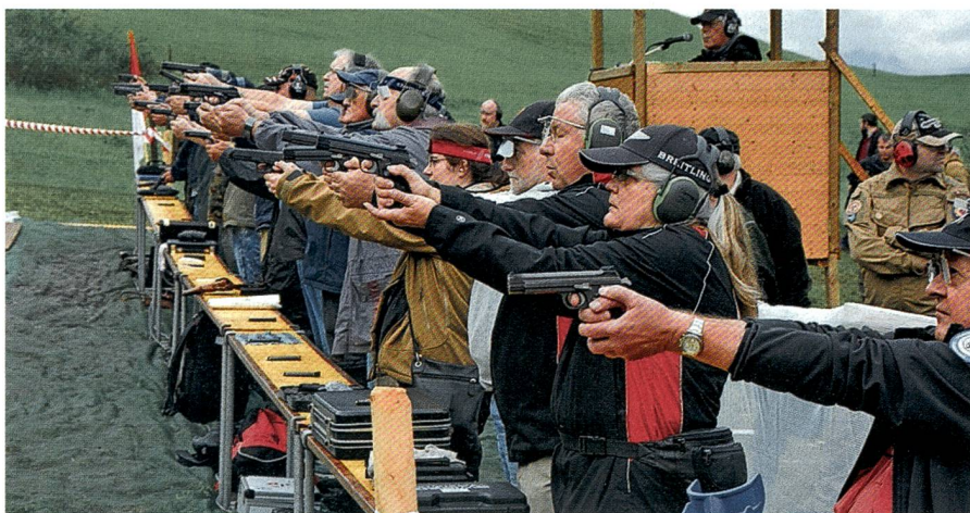
Anschlagen – Feuer: im 25-Meter-Feldstand der Pistolenschützen.