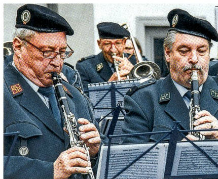
Die Ausserrhoder Inspektionsmusik.