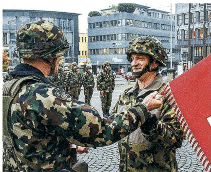
Die Berner Knechtenhofer und Schmidlin.