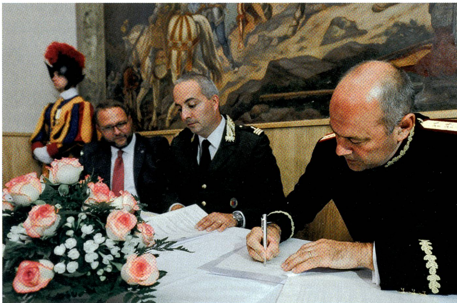
Staatsrat Gobbi, Oberst Cocchi (Kantonspolizei Tessin), Oberst Graf (Schweizergarde).

Die Rekruten profitieren von der Erfahrung und vom Fachwissen verschiedener Experten. Nach dieser Ausbildung wer-