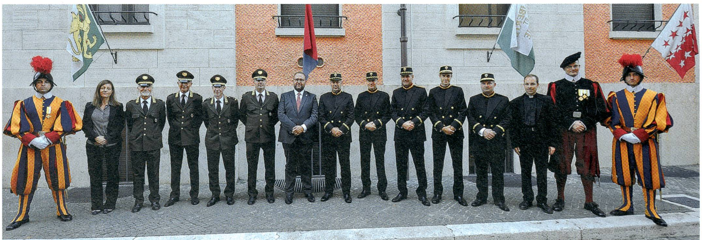
Vor der Tessinerfahne im Hof der Schweizergarde: die Vertreter des Kantons Tessin und der Päpstlichen Schweizergarde.

Die Schweizergarde, bestehend aus 110 Gardisten, wurde 1506 von Julius II. gegründet. Sie zeichnet für den Schutz des Papstes verantwortlich, begleitet ihn auf seinen Auslandsreisen und kontrolliert die Haupteingänge zur Vatikanstadt.