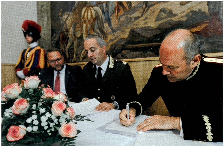
Staatsrat Gobbi, Oberst Cocchi (Kantonspolizei Tessin), Oberst Graf (Schweizergarde).

Die Rekruten profitieren von der Erfahrung und vom Fachwissen verschiedener Experten. Nach dieser Ausbildung wer-