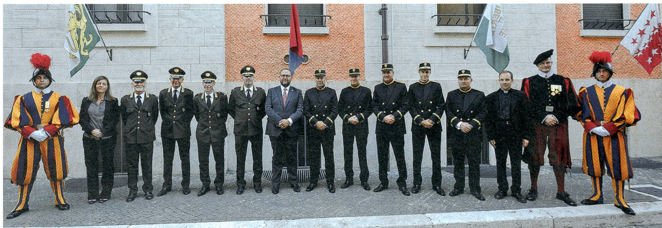
Vor der Tessinerfahne im Hof der Schweizergarde: die Vertreter des Kantons Tessin und der Päpstlichen Schweizergarde.

Die Schweizergarde, bestehend aus 110 Gardisten, wurde 1506 von Julius II. gegründet. Sie zeichnet für den Schutz des Papstes verantwortlich, begleitet ihn auf seinen Auslandsreisen und kontrolliert die Haupteingänge zur Vatikanstadt.