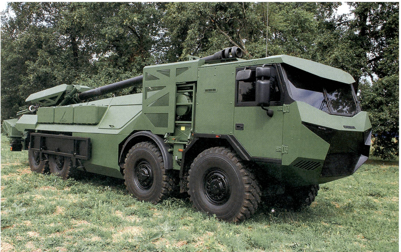
Der französische Camion Equipé d'un Système d'Artillerie CAESAR wurde von Nexter schon an mehrere Armeen verkauft.

Wenn man mit einem solchen Geschütz Camp Security oder Feuerunterstützung aus einem Stützpunkt heraus macht (analog Afghanistan), dann hat man ein optimales Kostenverhältnis – sofern Manpower günstig ist.» red.