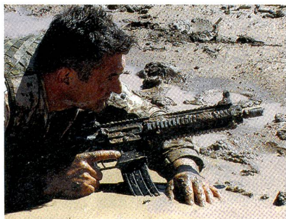
Commando-Sturmgewehr im Einsatz.

Neben Frankreich hat auch Norwegen das HK416 als Standardgewehr eingeführt. Selbst das Kommando Spezialkräfte (KSK) der Bundeswehr und die Antiterror-einheit des Bundes, die Grenzschutzgruppe 9 (GSG9), führen das HK416 im Bestand.