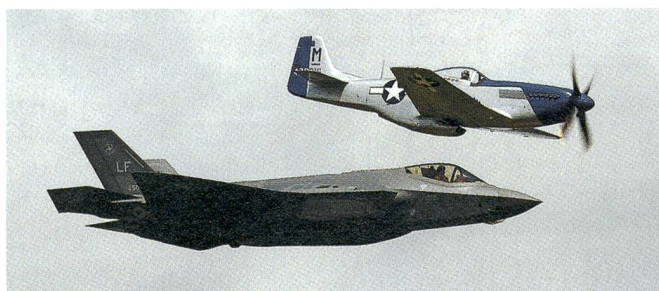
F-35A mit historischem P-51D Mustang.