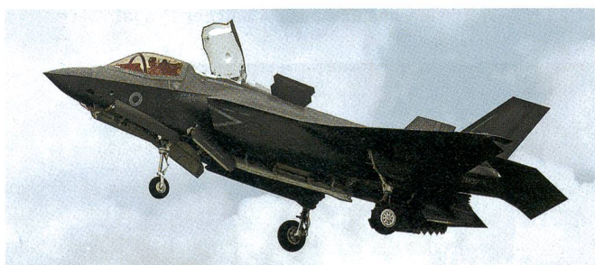
F-35B in den Farben der Royal Air Force.