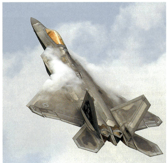
Ein amerikanischer F-22 Raptor steigt steil in den Himmel.