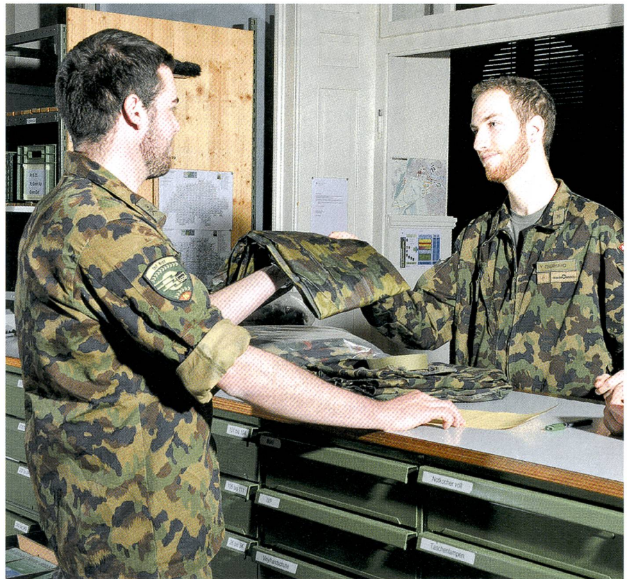
Gute Bedienung und Zusammenarbeit im Materialwesen – freundlich, versteht sich.

Das Thema Materialbewirtschaftung beinhaltet einen Besuch des Zentralen Kleidermagazins (ZKM) auf dem Waffenplatz Thun inklusive gegenseitigem Erfahrungsaustausch.