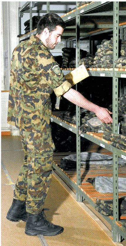
Gründliche Ausbildung für Mat Chefs.