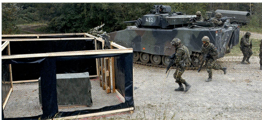
Panzergrenadier-Angriff im überbauten Gelände. Hinten der Schützenpanzer 2000.