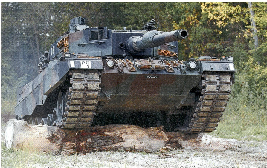
Kraftvoll überwindet der 56 Tonnen schwere Kampfpanzer Nummer 08 das Hindernis.