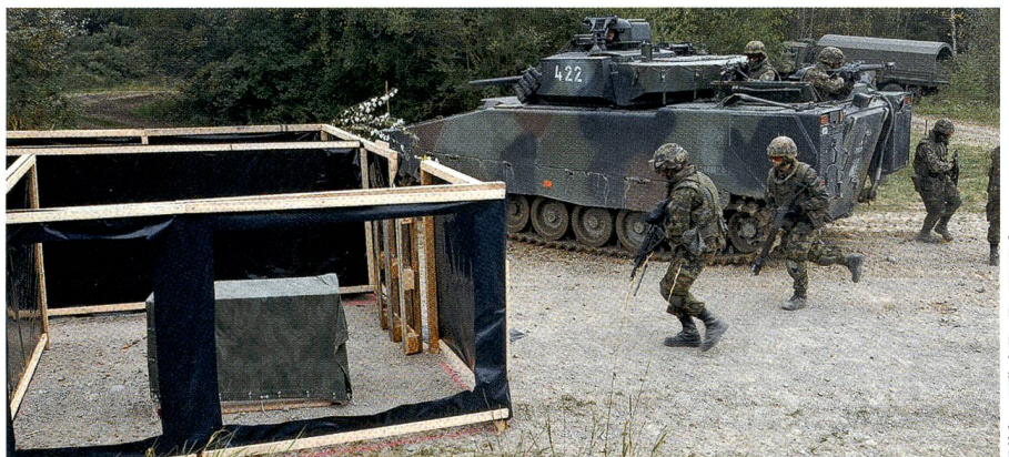
Panzergrenadier-Angriff im überbauten Gelände. Hinten der Schützenpanzer 2000.