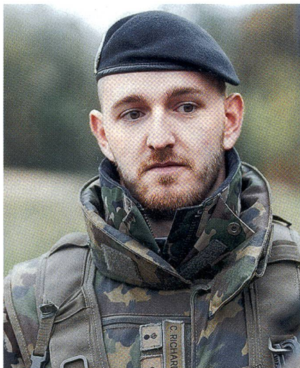
Auf die Unteroffiziere kommt es an!