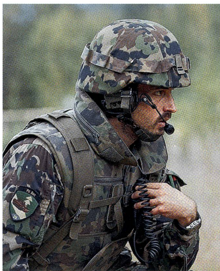
Die Panzergrenadierkompanie 29/4, als solche erkennbar am blauen Halbkreis.