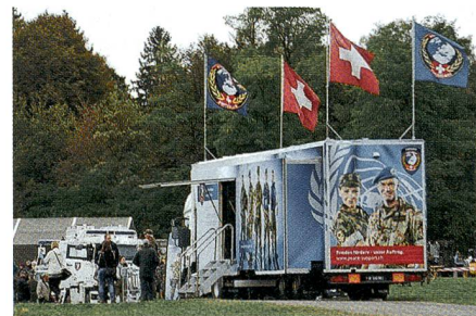
Auch SWISSINT ist sehr gut vertreten.