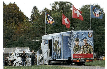
Auch SWISSINT ist sehr gut vertreten.