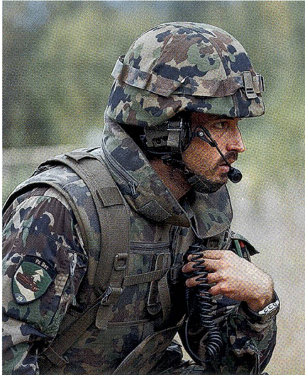
Die Panzergrenadierkompanie 29/4, als solche erkennbar am blauen Halbkreis.