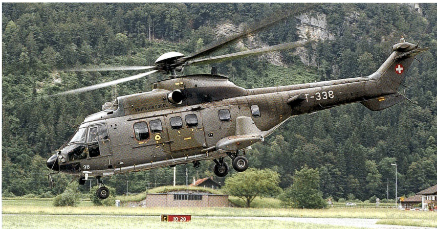
Die Unglücksmaschine, der Cougar T-338. Die Cougar tragen Nummern über T-331. Die Medien meldeten falsch den Absturz eines Superpuma (Nummern nur bis T-325).

in kurzen Worten mit, der Helikopter habe beim Rückflug vom Pass eine Stromleitung gestreift. Ebenso dämpfte Bundesrat Guy Parmelin, auch er oben auf dem Gotthard, die Spekulationen in einem ruhigen, gesetzten Statement.