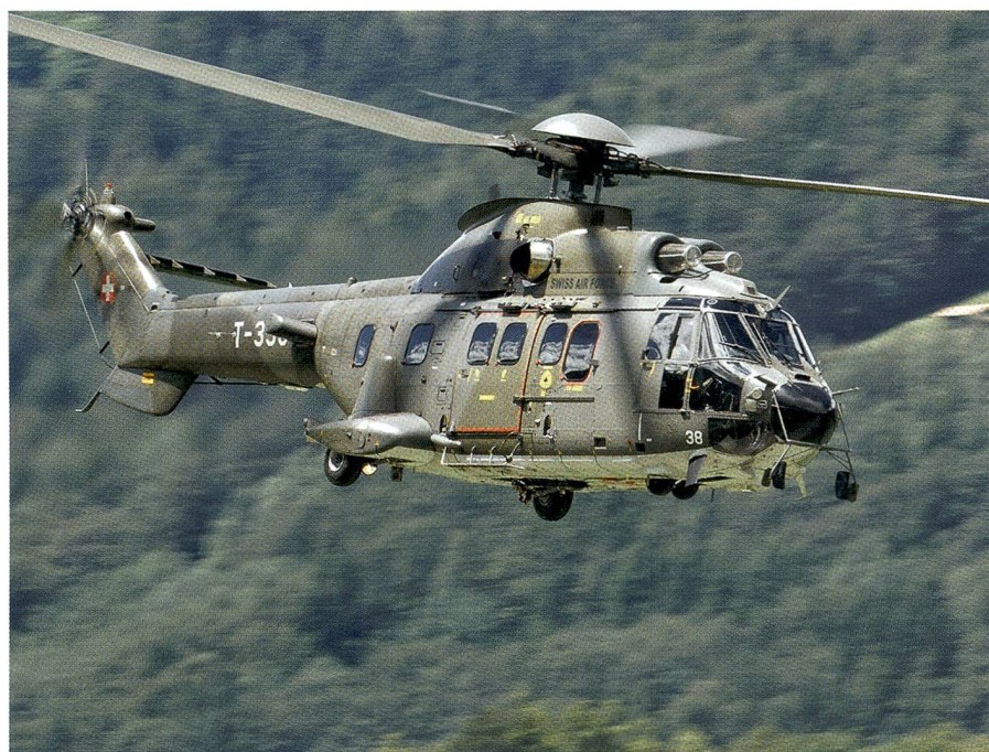
Das Bild unseres Aviatikfotografen Franz Knuchel zeigt den Transporthelikopter Cougar T-338, der am 28. September 2016 beim Start auf dem Gotthard zerschellte.

Beide, Bättig und Löchel, waren fröhliche, zupackende Männer. Als Parteifreunde den Stadtrat Bättig als Stadtpräsidenten ins Spiel bringen wollten, lehnte Bättig dankend ab: Er wolle ein Amt, wo er direkt zupacken könne, keine «politische»