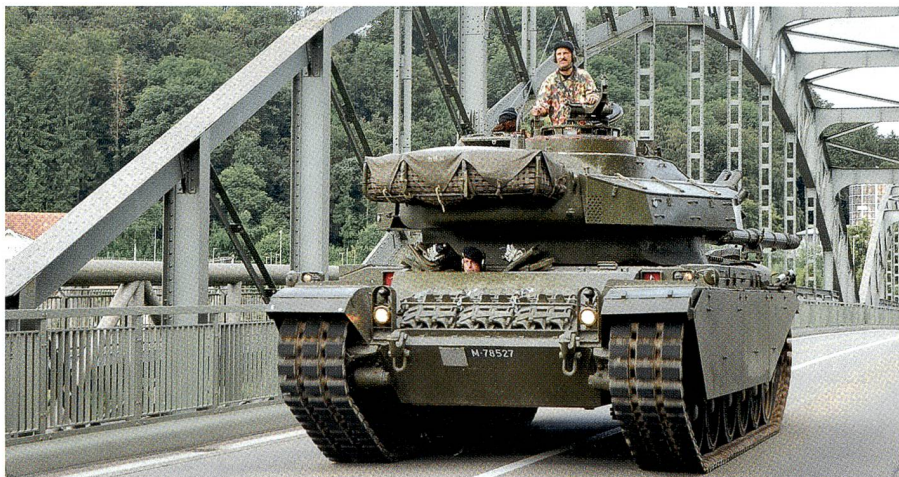
Der legendäre Centurion-Panzer der Schweizer Armee – Lesen Sie Seiten 37–39.