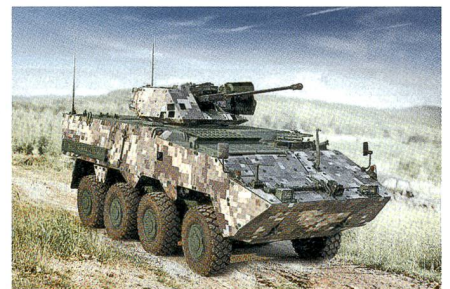
Slowakischer Radschützenpanzer Corsac.

Die slowakische MSM Group hat auf Basis des Truppentransporters Pandur II von General Dynamics European Land Systems (GDELS)-Steyr das gepanzerte Radfahrzeug 8x8 Corsac entwickelt. Der Prototyp wurde gemeinsam von EVPU, Konstrukta Defence und GDELS-Steyr entwickelt. Der