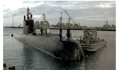
Kampfwertsteigerung der peruanischen U-Boote der Klasse 209/1200.

ThyssenKrupp Marine Systems (TKMS) hat von der peruanischen Marine bzw. der peruanischen Marinewerft SIMA einen Auftrag im Umfang von 40 Millionen Euro für die grundlegende Modernisierung von vier