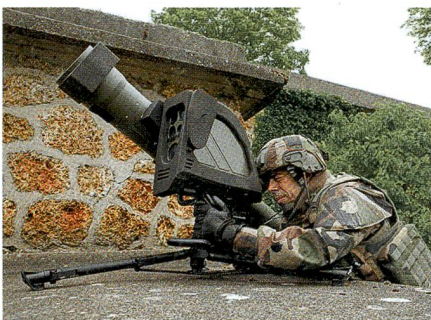
Das neue Panzerabwehrsystem MMP.

MMP ist eine neue Generation von Boden-Boden-Raketen mit 4000 m Reichweite, einem Dual-Mode-Sucher sowie einer faseroptischen Datenverbindung, die sehr hohe Präzision bietet und Kollateralschäden minimiert. Das Raketensystem kann auf verschiedene Plattformen integriert und im abgessenen Kampf verwen-