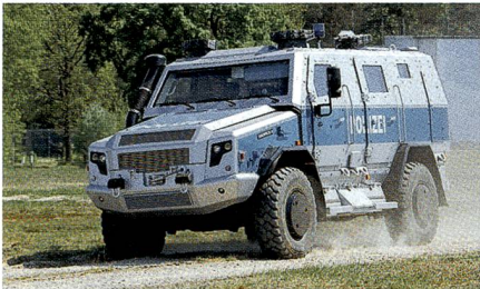
Personentransportfahrzeug Survivor R.

Gemeinsam mit Achleitner präsentierte RMMV ein kostengünstiges geschütztes Personentransportfahrzeug. Basierend auf einem 242 kW starken Lkw-Fahrgestell